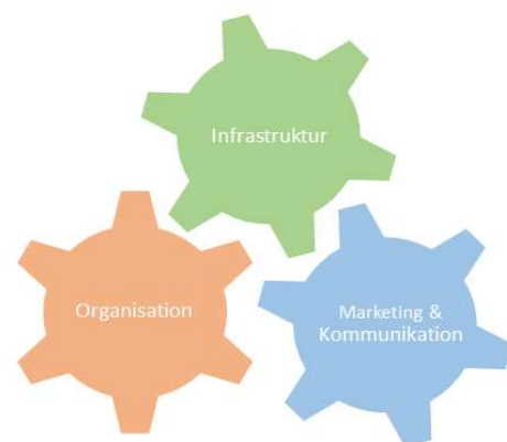
Grafik 1: Maßnahmen - Mix

Für die Auszeichnung mit dem Mobil-Siegel ist der Mix aus verschiedenen Maßnahmen wichtig. Denn eine Radförderung, die keiner kennt, kann keine Wirkung entfalten, genauso wenig wie ein mobiler Arbeitsplatz, wenn Konferenzen nur als Präsenztermin geplant werden. Rabatte bei Car-Sharing-Anbietern sind wirkungslos, wenn man nicht weiß wo der nächste Car-Sharing-Parkplatz ist. Die Beispiele verdeutlichen: ein Mix aus verschiedenen Maßnahmen ist wichtig, damit die ergriffenen Maßnahmen auch ihre Wirkung entfalten können. Diesen „Maßnahmen-Mix“ stellen wir in den Mittelpunkt, indem Maßnahmen aus den Bereichen „Marketing & Kommunikation“, „Organisationskultur“ und „Infrastruktur“ für eine Auszeichnung vorhanden müssen und bewertet werden.